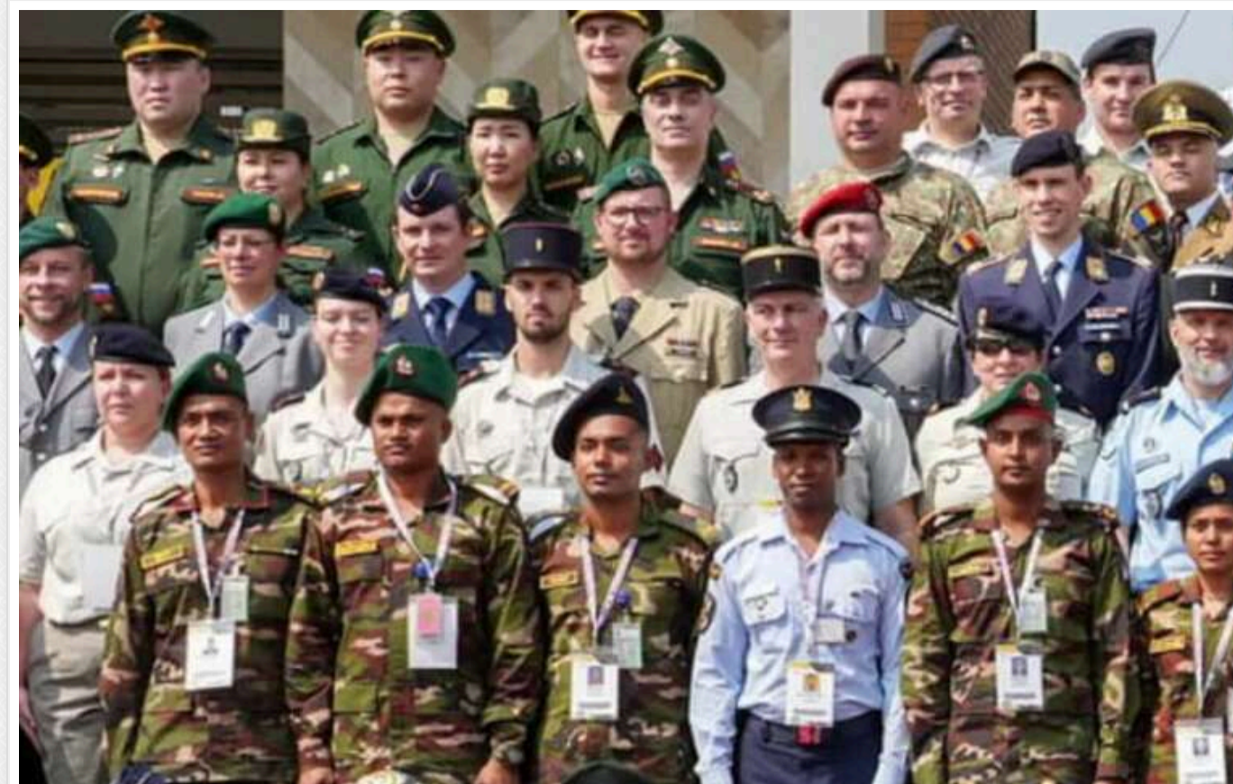
Bild: У Німеччині проводять перевірку щодо участі своїх військових у змаганнях, на яких були присутні солдати РФ

Міністерство оборони Німеччини розпочало перевірку через участь своїх військових у змаганнях, на яких були присутні російські солдати. Це стосується заходу під егідою військово-спортивної асоціації CISM (Conseil International du Sport Militaire).