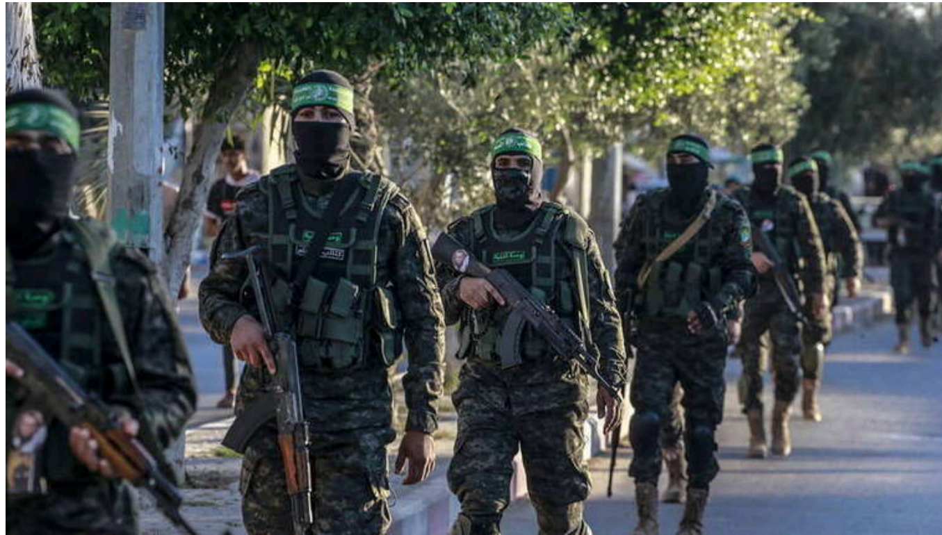
NYT: ХАМАС минулого року хотів переконати Іран і "Хезболлу" долучитися до атаки на Ізраїль

Лідери терористичного угруповання ХАМАС під час підготовки атаки на Ізраїль 7 жовтня 2023 року намагалися переконати ліванську "Хезболлу" та Іран взяти участь у нападі. Атаку мали намір здійснити ще у 2022 році, але відклали плани, намагаючись заручитися підтримкою союзників.