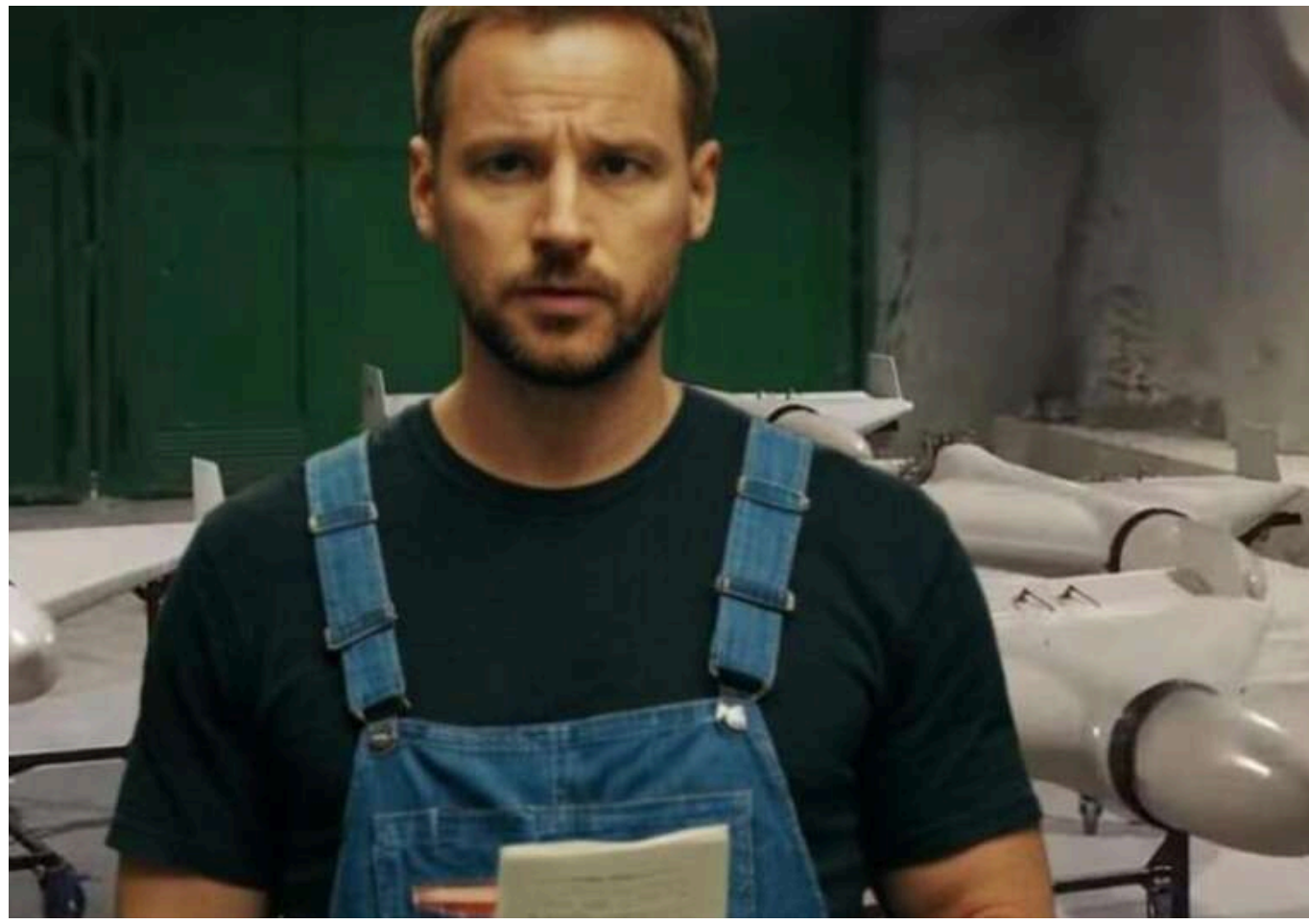
Росіяни хочуть налагодити в ОРДЛО виробництво Shahed

Російські загарбники прагнуть організувати виробництво іранських дронів-камікадзе типу Shahed на захоплених підприємствах у тимчасово окупованих регіонах сходу України.