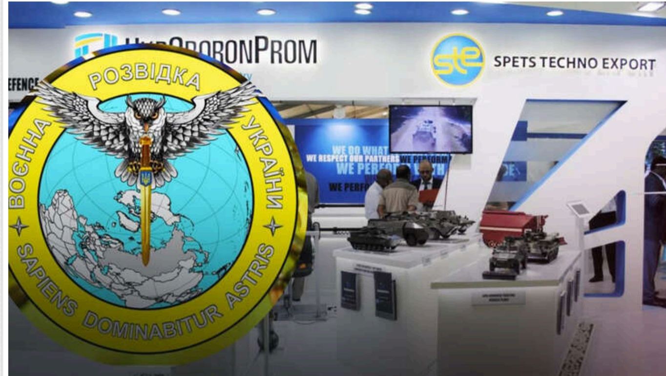
Чому озброєння має більшу значимість за політику в умовах широкомасштабного вторгнення

Минулої п'ятниці редакції "УП стало відомо, що після їхньої публікації про переплати за озброєння державне підприємство "Спецтехноекспорт" звернулося до СБУ в зв'язку з "витокom інформації з обмеженим доступом".