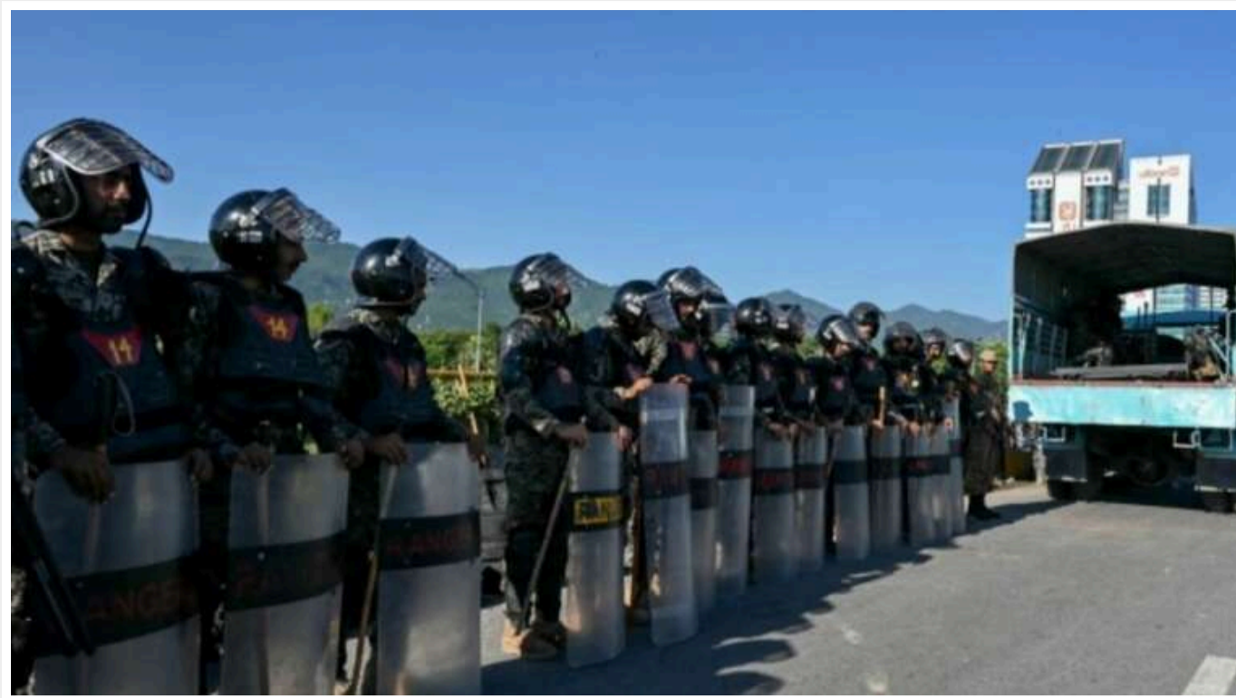
У Пакистані напередодні саміту ШОС посилюють заходи безпеки

Уряд Пакистану 13 жовтня планує закрити столицю Ісламабад напередодні саміту Шанхайської організації співробітництва (ШОС) через нещодавнє насильство з боку бойовиків і політичні заворушення.