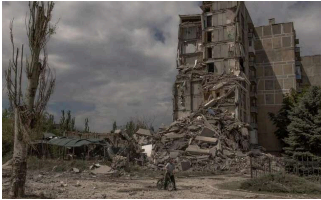
Військовий розповів, у якому місті на Донеччині найближчим часом очікуються найзапекліші бої

У найближчому майбутньому найзапеклішою битвою стане битва за Торезьк Донецької області.