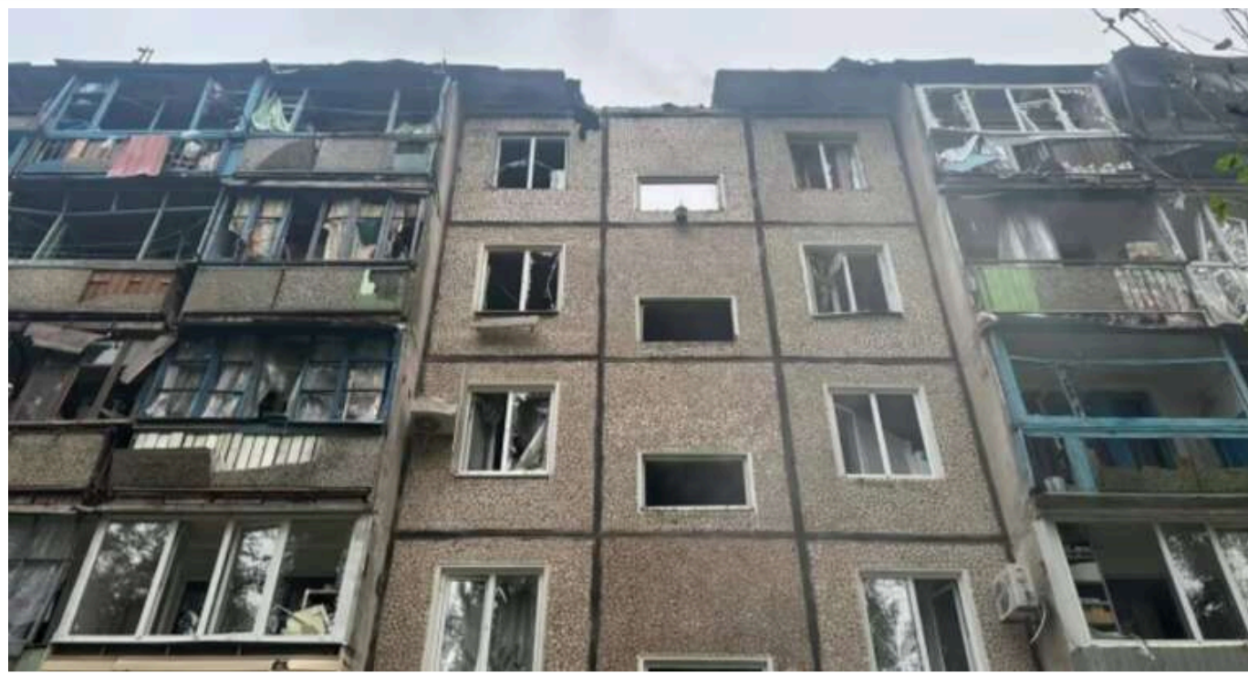
РФ цього тижня скинула на Україну 900 КАБів, - Зеленський

Усього за один тиждень росіяни використали проти України приблизно 900 керованих авіаційних бомб.