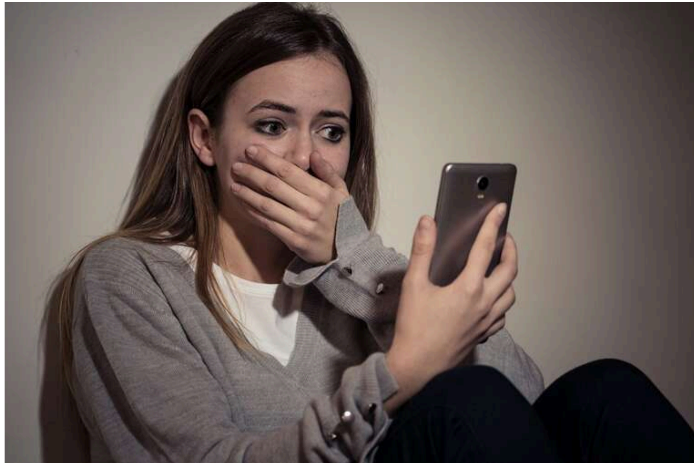
В Україні хочуть запровадити в законодавство покарання за сталкінг та переслідування в соцмережах