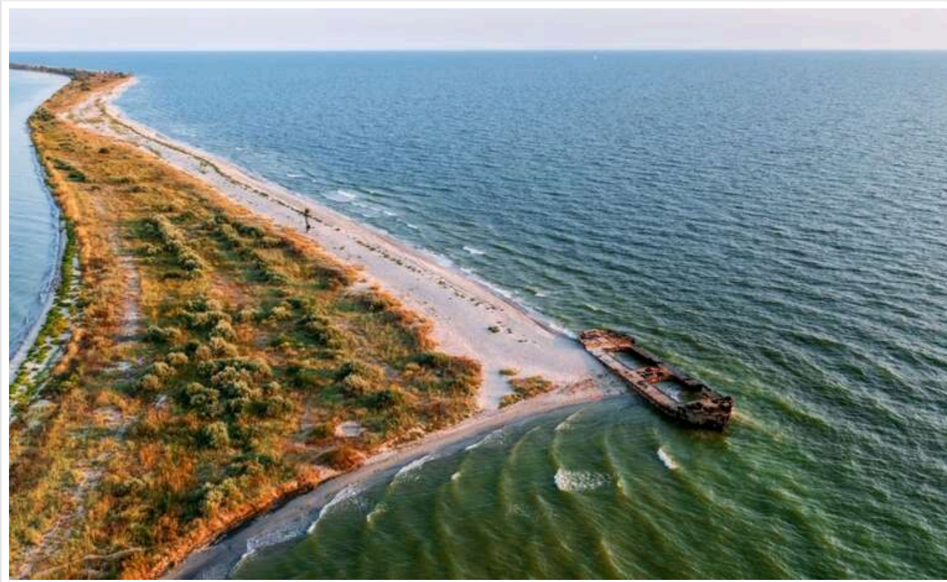
Окупанти активізувалися на Кінбурнській косі

Держава-агресорка перекидає свої сили на Кінбурнську косу (Миколаївська область). Українські військові зазначають, що там зараз "досить напружена ситуація".