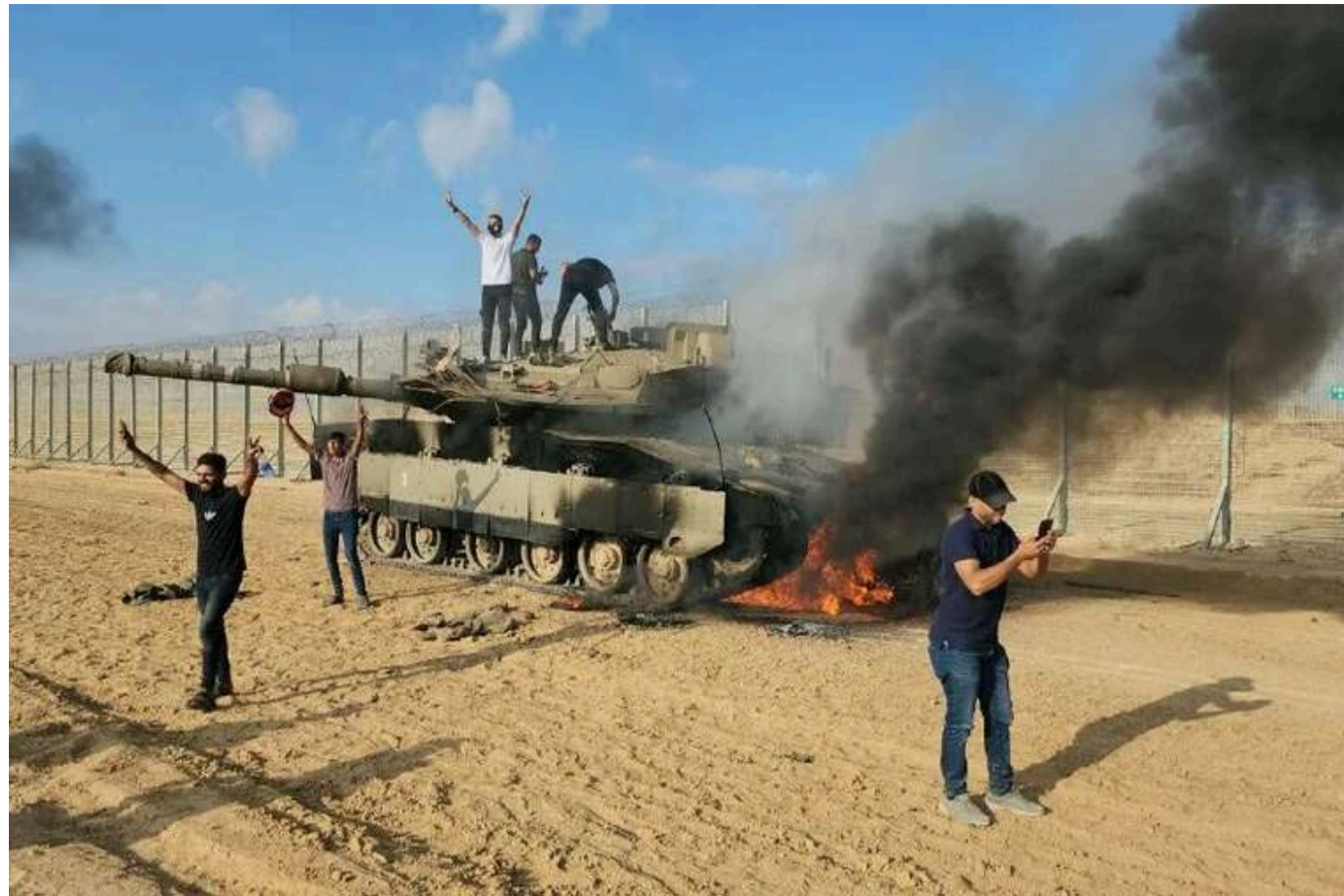
NYT: ХАМАС намагався переконати Іран приєднатися до своєї атаки на Ізраїль 7 жовтня

ХАМАС намагався переконати союзні Іран і «Хезболлу» приєднатися до атаки терористичного угруповання на Ізраїль 7 жовтня минулого року.