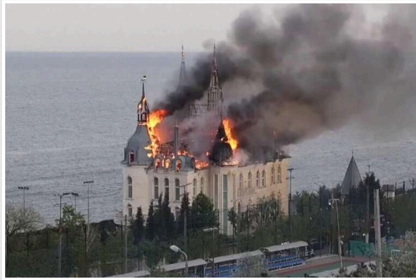
The Telegraph: Удари Росії по Одесі можуть спровокувати війну з НАТО

Упродовж останніх тижнів росіяни вже завдали ударів ракетами по кількох зерновозах, що експортували українське зерно.