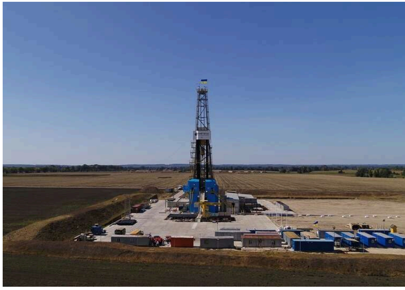
«Укргазвидобування» замовило барит за довоєнною ціною

АТ «Укргазвидобування» 24 вересня за результатами тендеру замовило ТОВ «Торгова труба компанія» бариту на 77,42 млн грн.