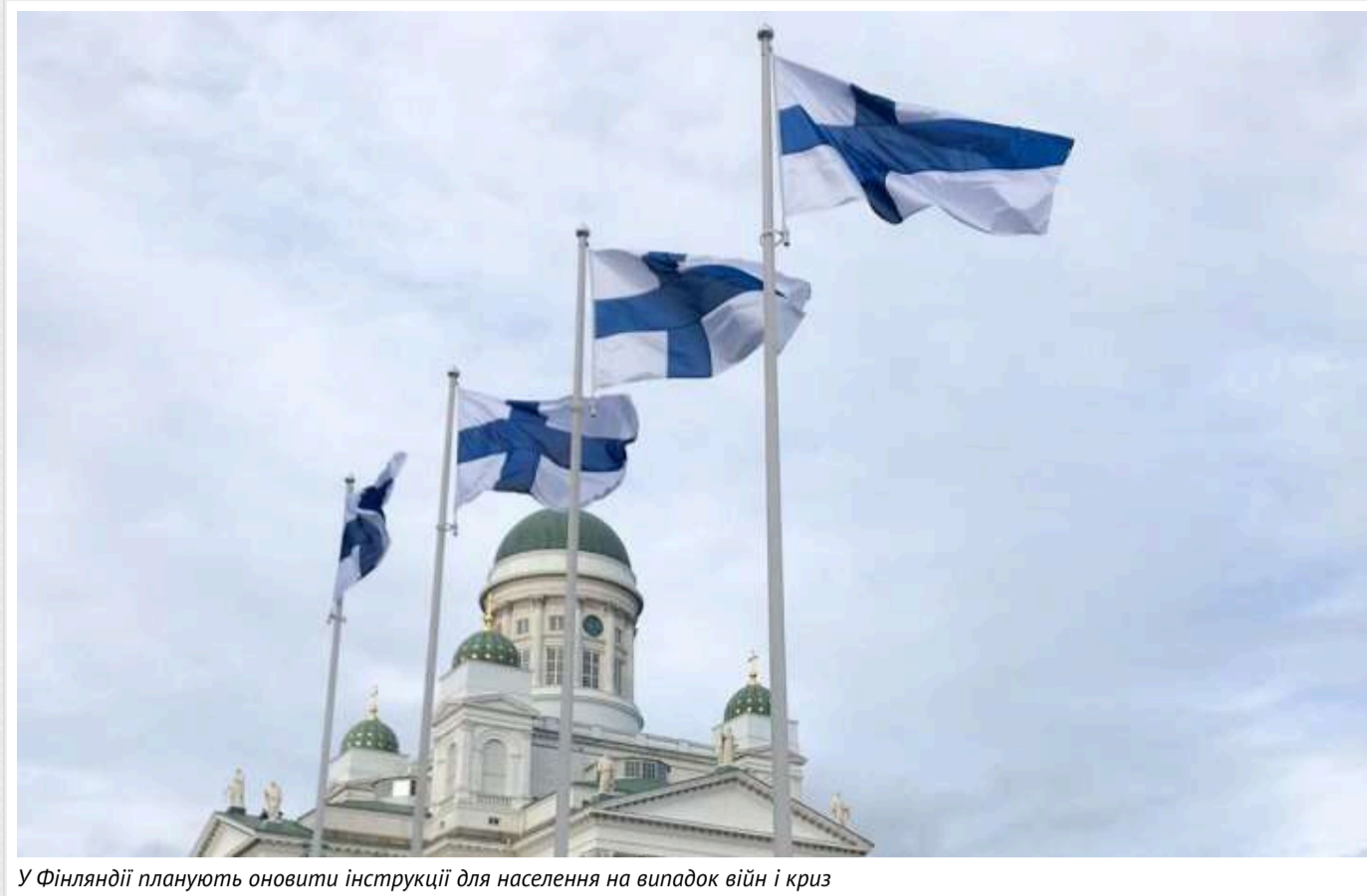
У Фінляндії планують оновити інструкції для населення на випадок війн і криз

У листопаді у Фінляндії вийдуть нові настанови для громадян, спрямовані на їх підготовку до можливої війни, потрясінь та кризових ситуацій.