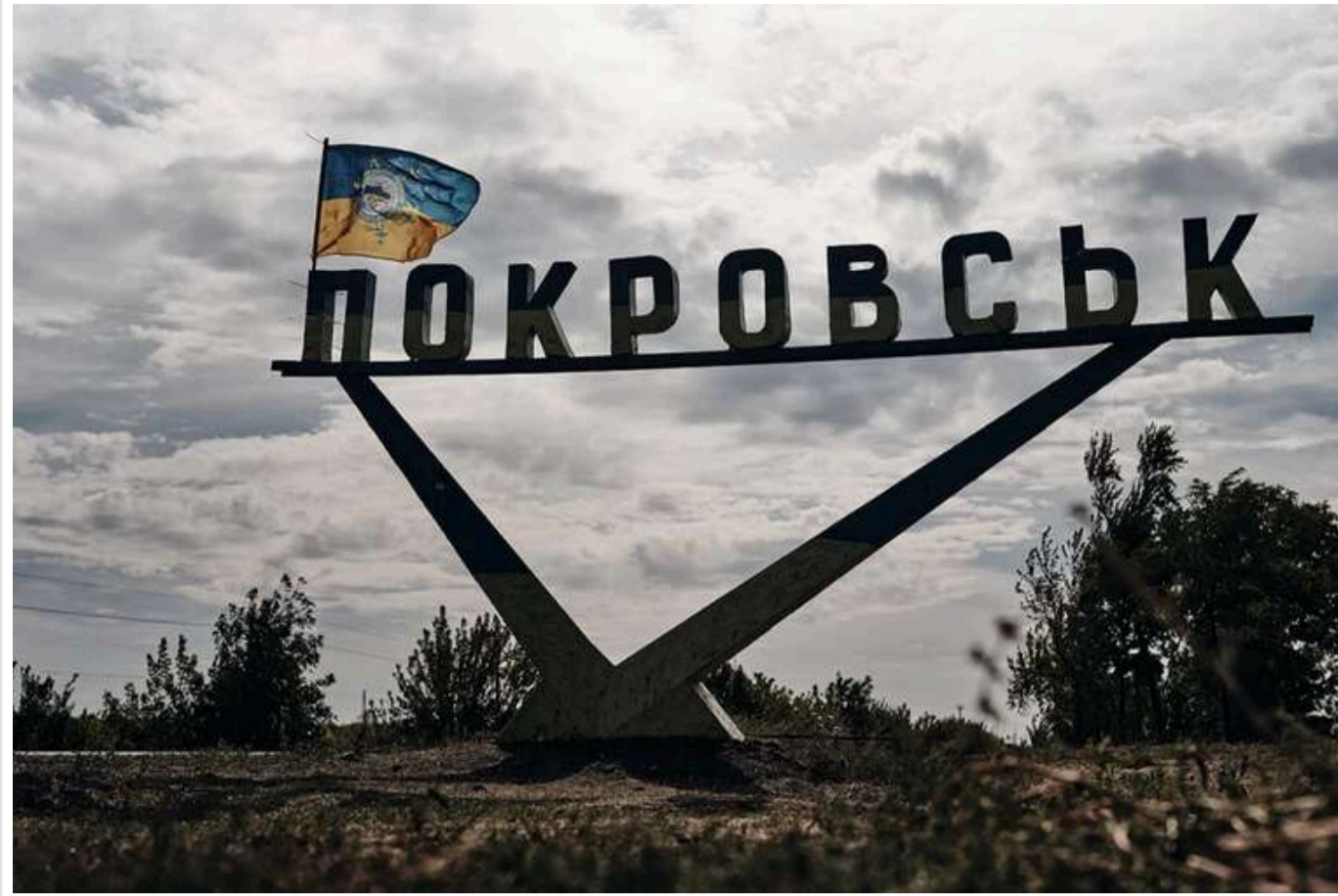
Foreign Policy: Втрата Покровська може обвалити економіку України

Втрати Покровська можуть серйозно ударити по економіці України, – повідомляє Foreign Policy.