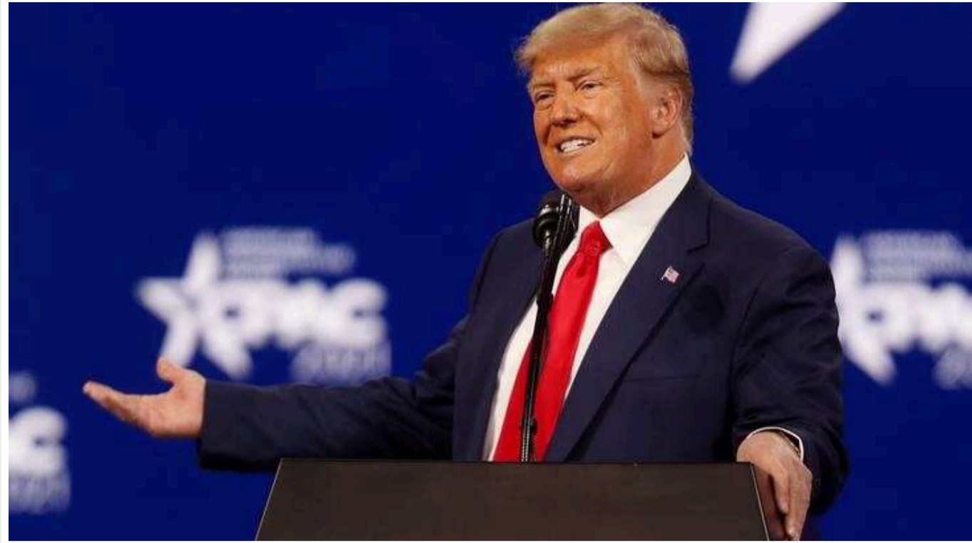
Вибори у США: штати, що вагаються, віддають перевагу Трампу в питанні війни в Україні

Виборці з коливних штатів США вважають, що експрезидент Дональд Трамп краще впорається з врегулюванням війни РФ проти України, ніж віцепрезидент Камала Гарріс. Це показують результати останніх опитувань.