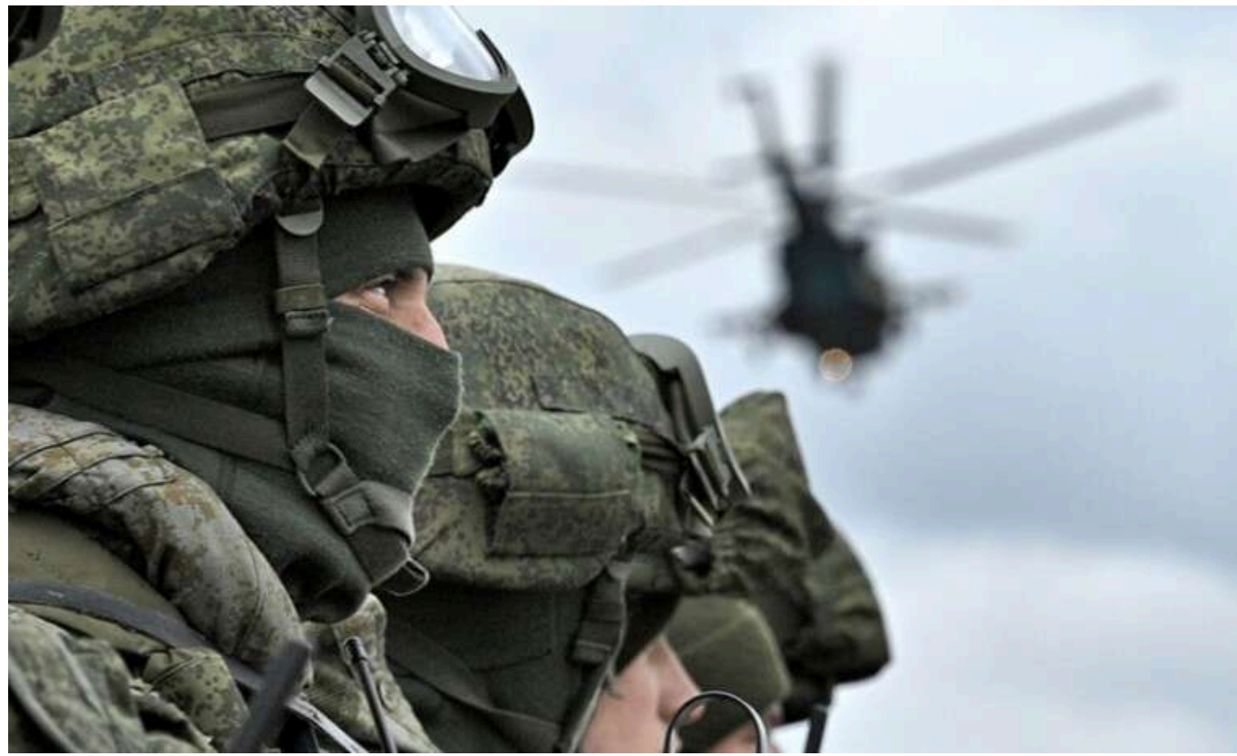
В РФ ветерани "СВО" скаржаться, що їх не шанують

Ветерани так званої "спецоперації" пожалілися пропагандистам, що їх ніхто не шанує.