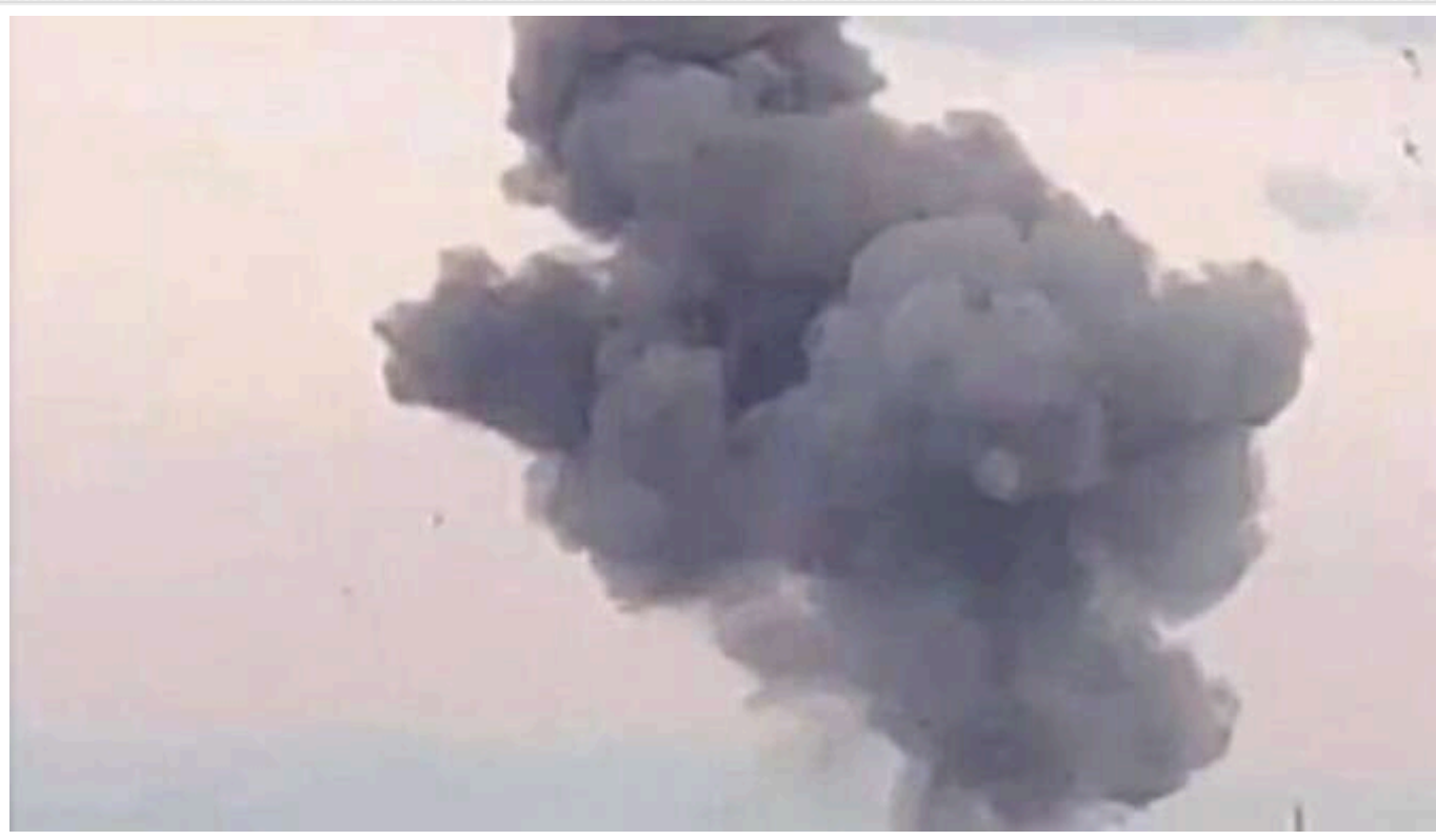
Окупанти завдали удару КАБом під Харковом

Під Харковом приліт КАБу в районі Дергачів.