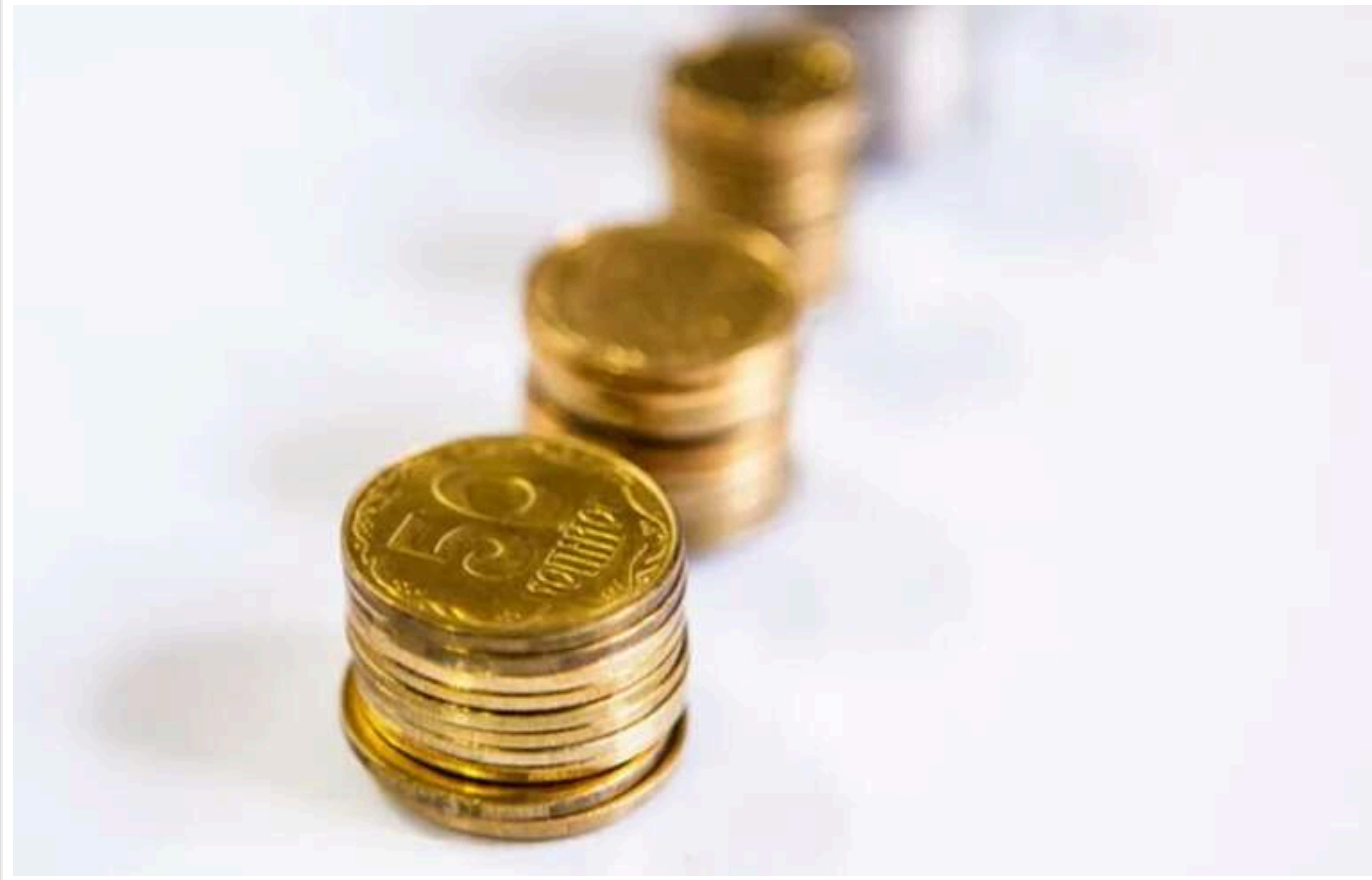
В Україні скасують "копійки": оголошено дату запровадження "шага"

В Україні "шаги", які мають замінити копійки, запровадять вже наступного року. У листі голови НБУ Андрія Пишного до спікера Верховної Ради Руслана Стефанчука зазначається, що перші 20 мільйонів "шагів" можуть бути випущені на початку 2025 року.