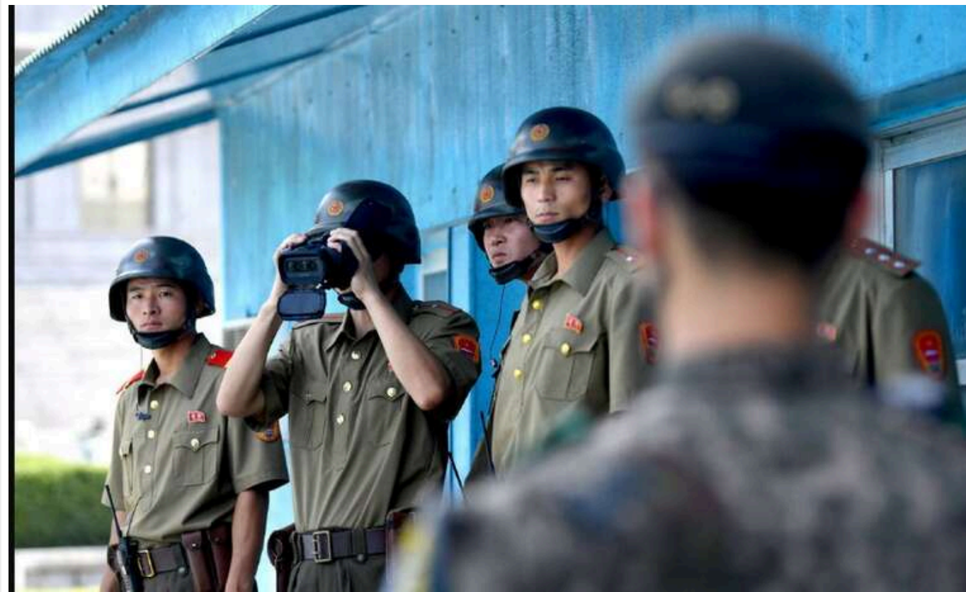
В Україні на боці РФ воюють кілька тисяч солдатів із Північної Кореї, - ISW

В Україні беруть участь у бойових діях солдати з Північної Кореї. Деякі військові проходять тренування в Росії, щоб, ймовірно, бути задіяними разом із російськими силами в майбутньому.