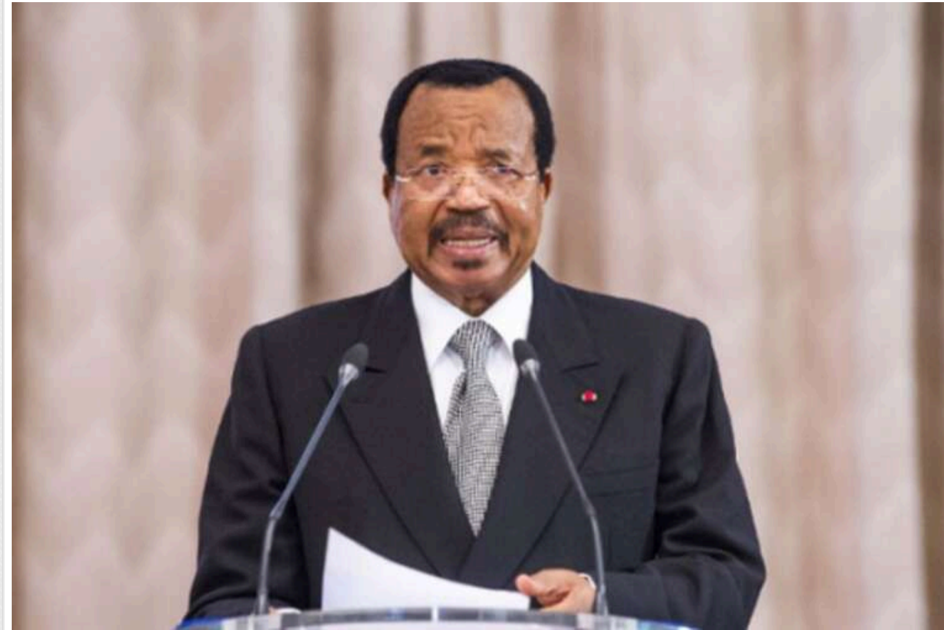
У Камеруні уряд заборонив обговорення здоров'я президента в ЗМІ та соціальних мережах

Уряд Камеруну заборонив обговорювати в засобах масової інформації стан здоров'я президента Поля Бії, відсутність якого з минулого місяця викликала спекуляції щодо його здоров'я.