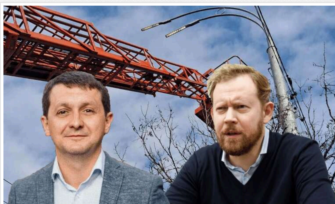
У Нацполіції розслідують можливе розкрадання під час ремонту мереж зовнішнього освітлення “Київміськвітлом”

Основне управління Нацполіції Києва проводить розслідування щодо можливого розкрадання та привласнення бюджетних коштів під час виконання капітальних ремонтів мереж вуличного освітлення на 13 вулицях в Оболонському районі (здебільшого – в Пуща-Водиці).