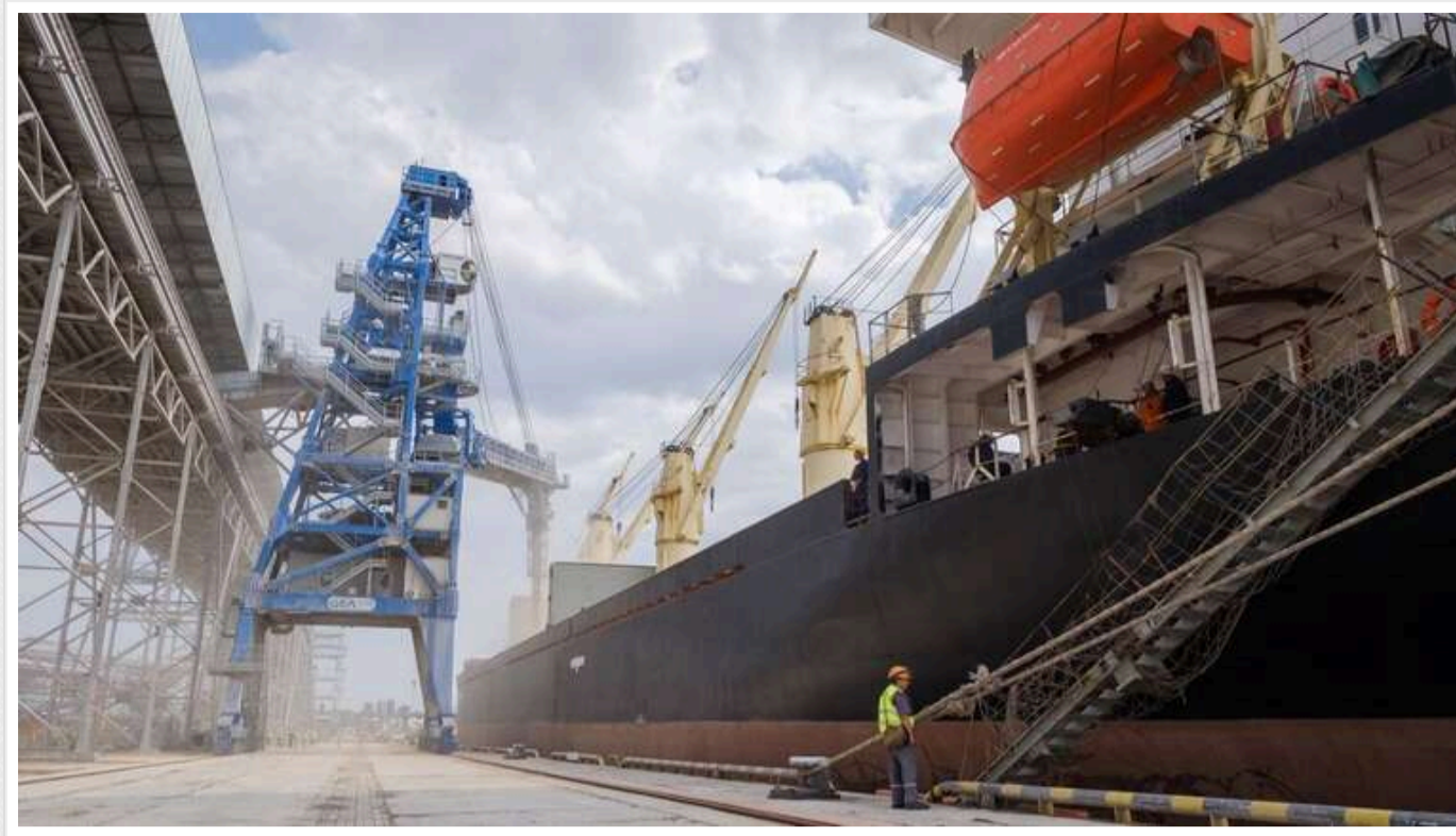
Країни Перської затоки чинять тиск на Вашингтон, щоб зупинити атаки Ізраїлю на іранські нафтові об'єкти