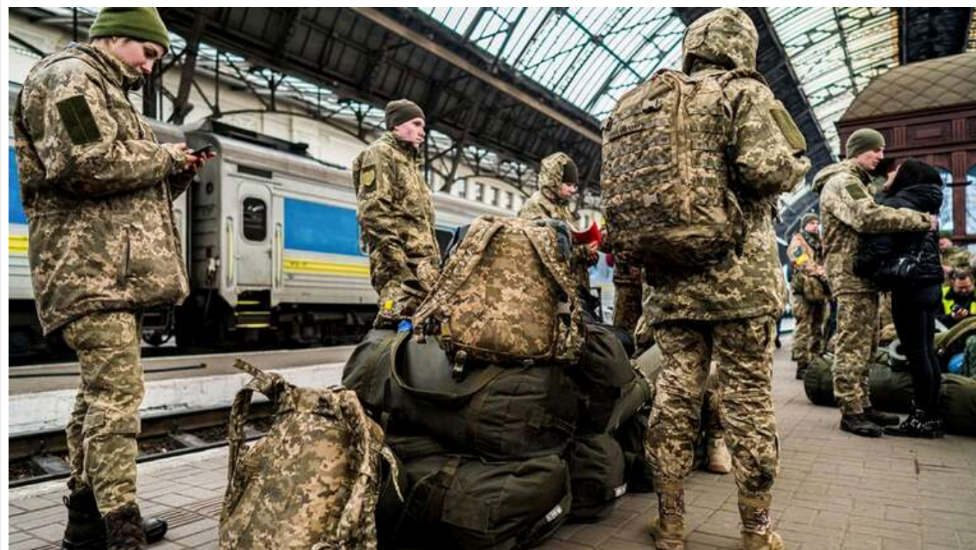
Що кажуть військові щодо заборони мобілізації українців до 25 років

9 жовтня Верховна Рада остаточно заборонила мобілізацію українців до 25 років. Втім, військові мають іншу думку. Ба більше, дехто вважає, що мобілізаційний вік в Україні повинен починатися з 18 років.