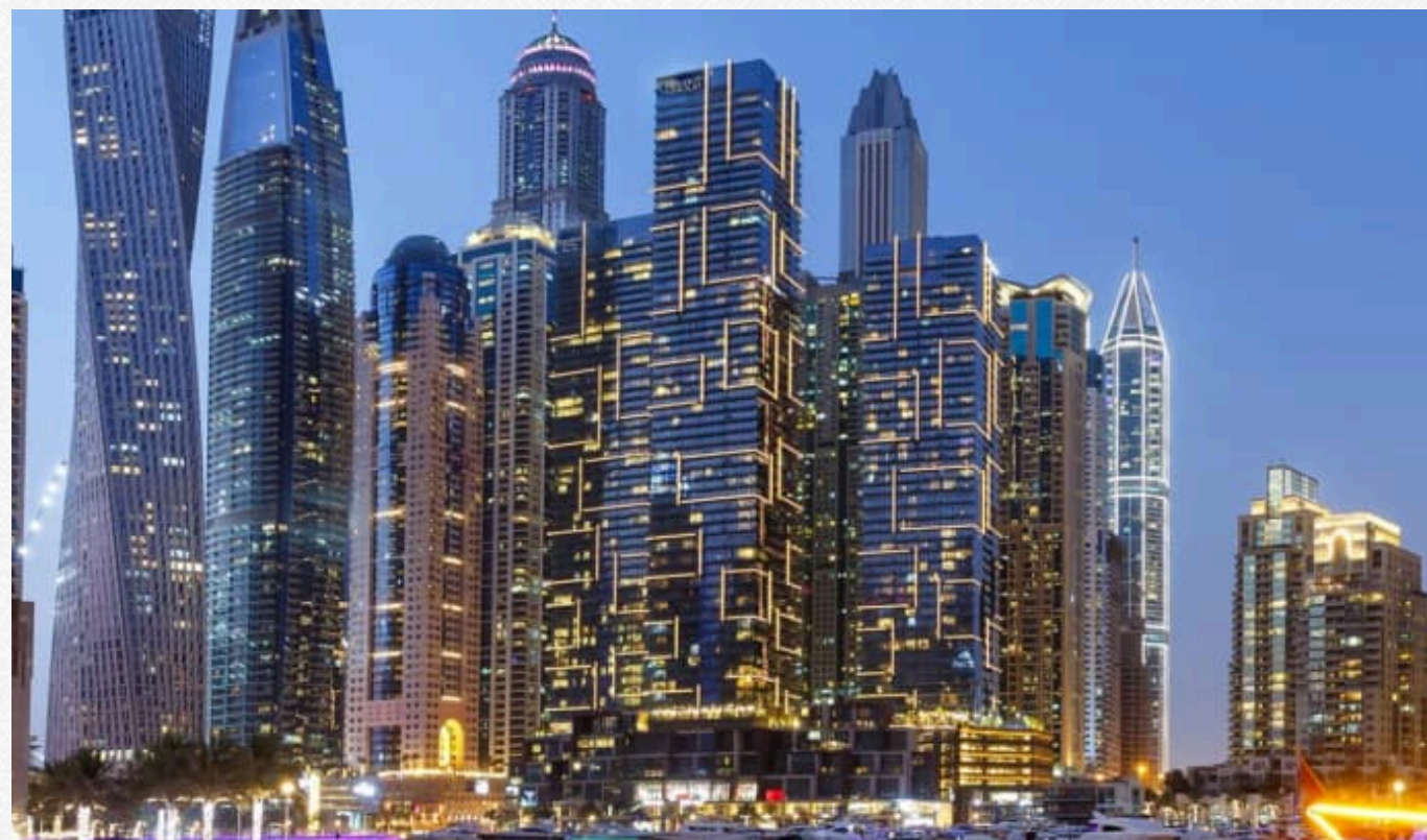
The Residences at Marina Gate II

Ця квартира міститься у житловому комплексі преміумкласу The Residences at Marina Gate II, який звели у 2019 році. На сайті забудовника, компанії Select Group, зазначено, що "Marina Gate II пропонує розкішне життя в центрі одного з найбільш привабливих районів Дубая".