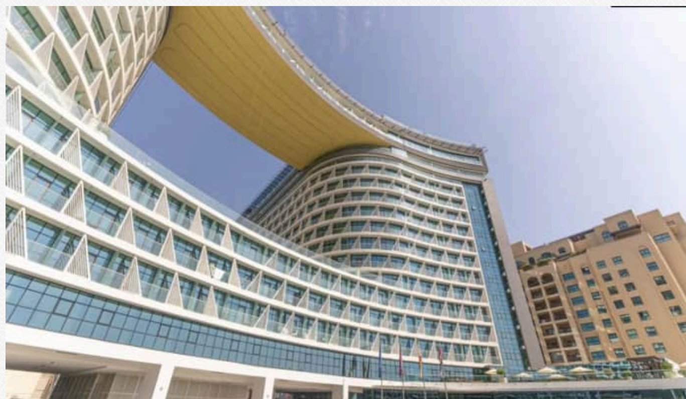
Seven Hotel and Apartments The Palm

"Готельний номер – здається в оренду. Та скільки саме грошей приносить Розенблат – напевно невідомо. Інформація про це в реєстрі відсутня, адже кошти з оренди спершу отримує готель", - зазначають журналісти.