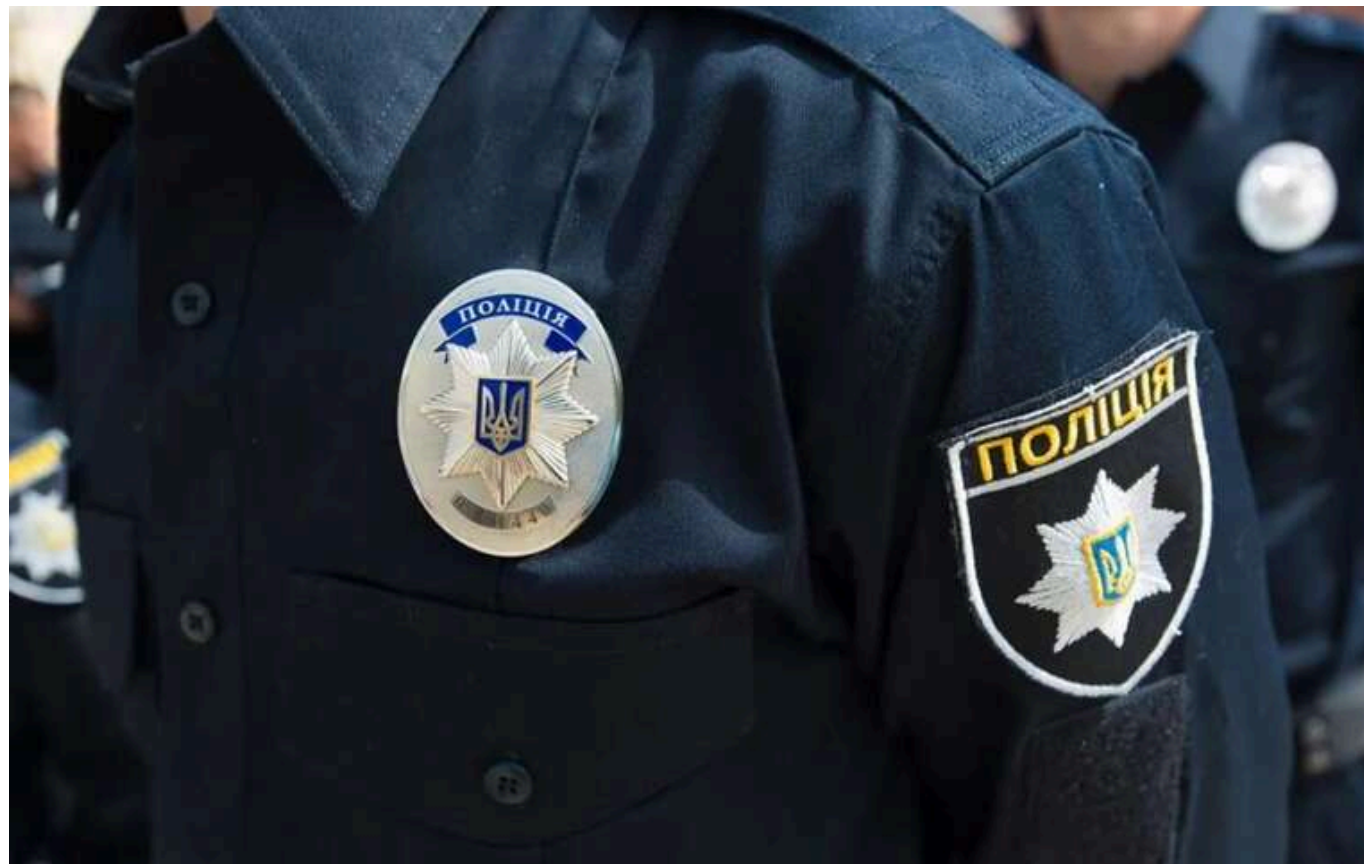
У Хмельницькому студент після побиття опинився в реанімації

Проблеми у хлопця почалися відразу з початком навчального року. У нього швидко закінчувалися кошти, однак він не розповідав нічого батькам, каже мати потерпілого.