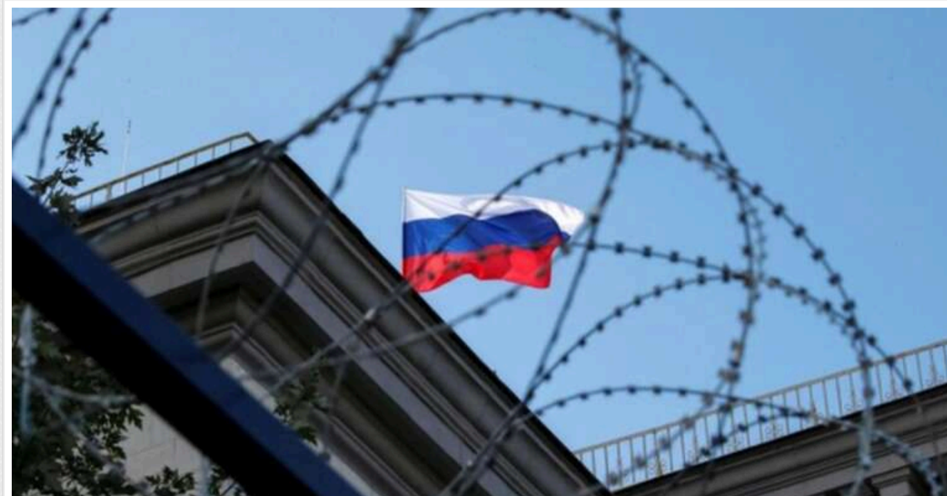
РФ знайшла спосіб обійти санкції, щоб купувати німецьке обладнання для виробництва зброї, - розслідування

Німецькі промислові товари далі потрапляють до Росії, обходячи європейські санкції.