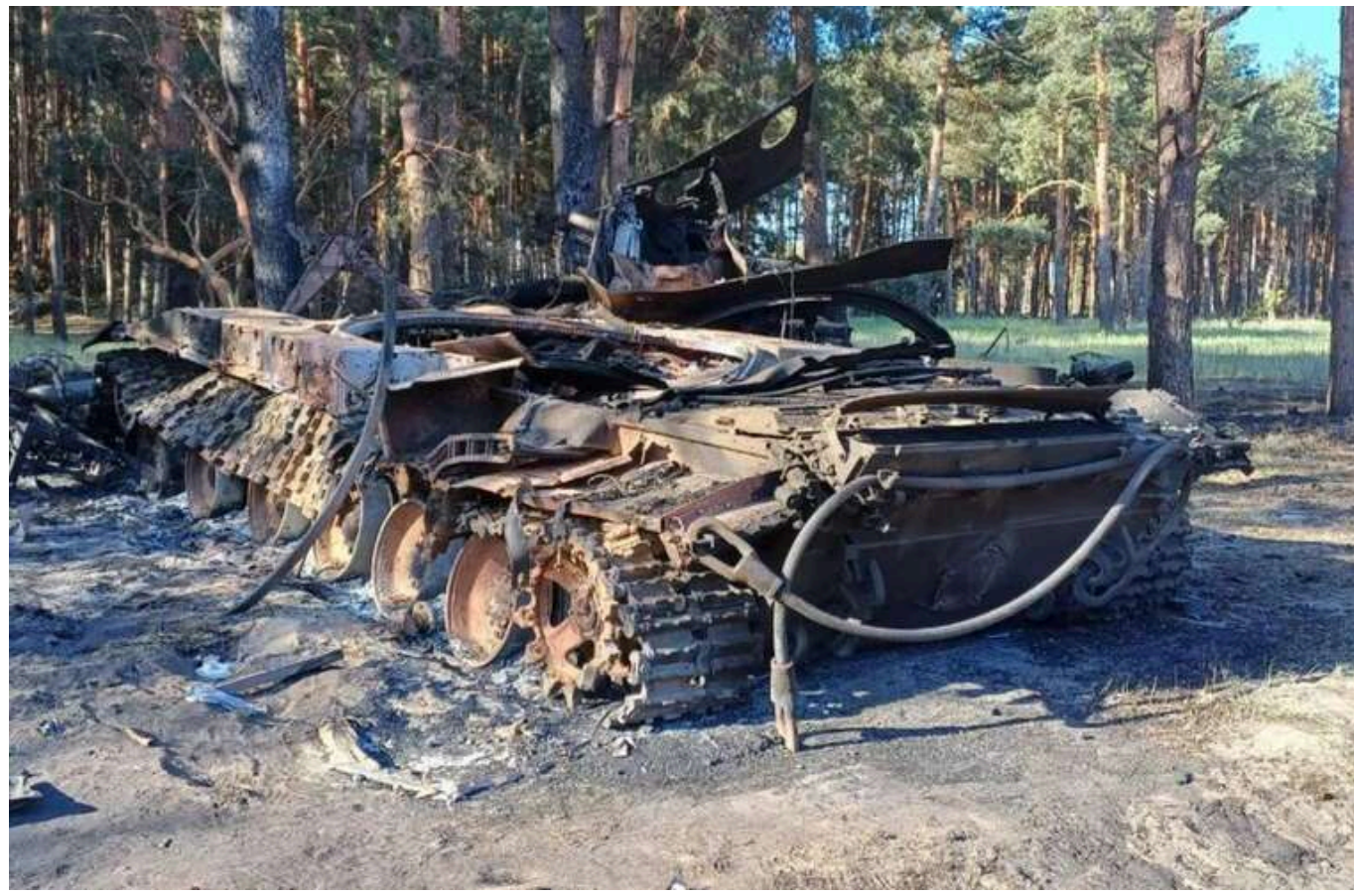
Вересень став найсмертоноснішим місяцем для Росії, - ЗМІ

Згідно з даними західних аналітиків, середній рівень втрат російської армії на фронті в Україні зріс до 1271 солдата.