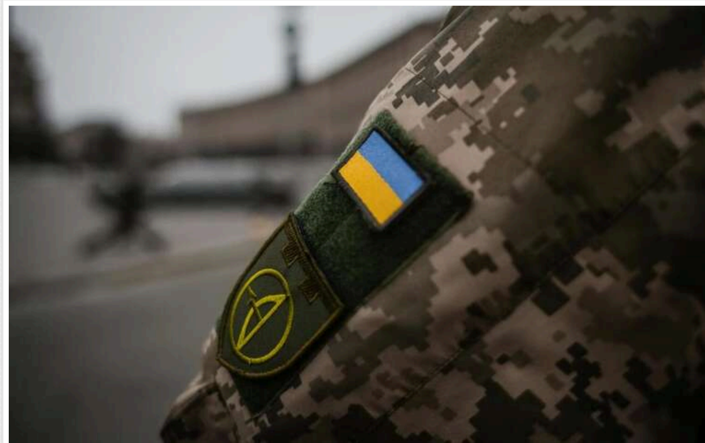
Мобілізація в Україні: перші повістки людям, які оновили дані, вже надійшли

Перші повістки людям, які оновили дані, вже надійшли, повідомляють джерела АНТИКОР у одному зі столичних ТЦК.