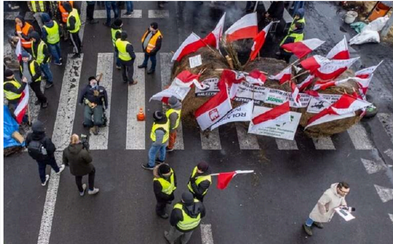
У Польщі можуть повернути блокаду на кордоні з Україною: як із цим пов'язана РФ та її "зерновий терор"

У Польщі можуть знову розпочатися протести на кордоні через експорт українських товарів. Такі заяви з'явилися після того, як унаслідок російських ракетних ударів було пошкоджено два вантажних судна на Одещині, що може вказувати на причетність Росії.