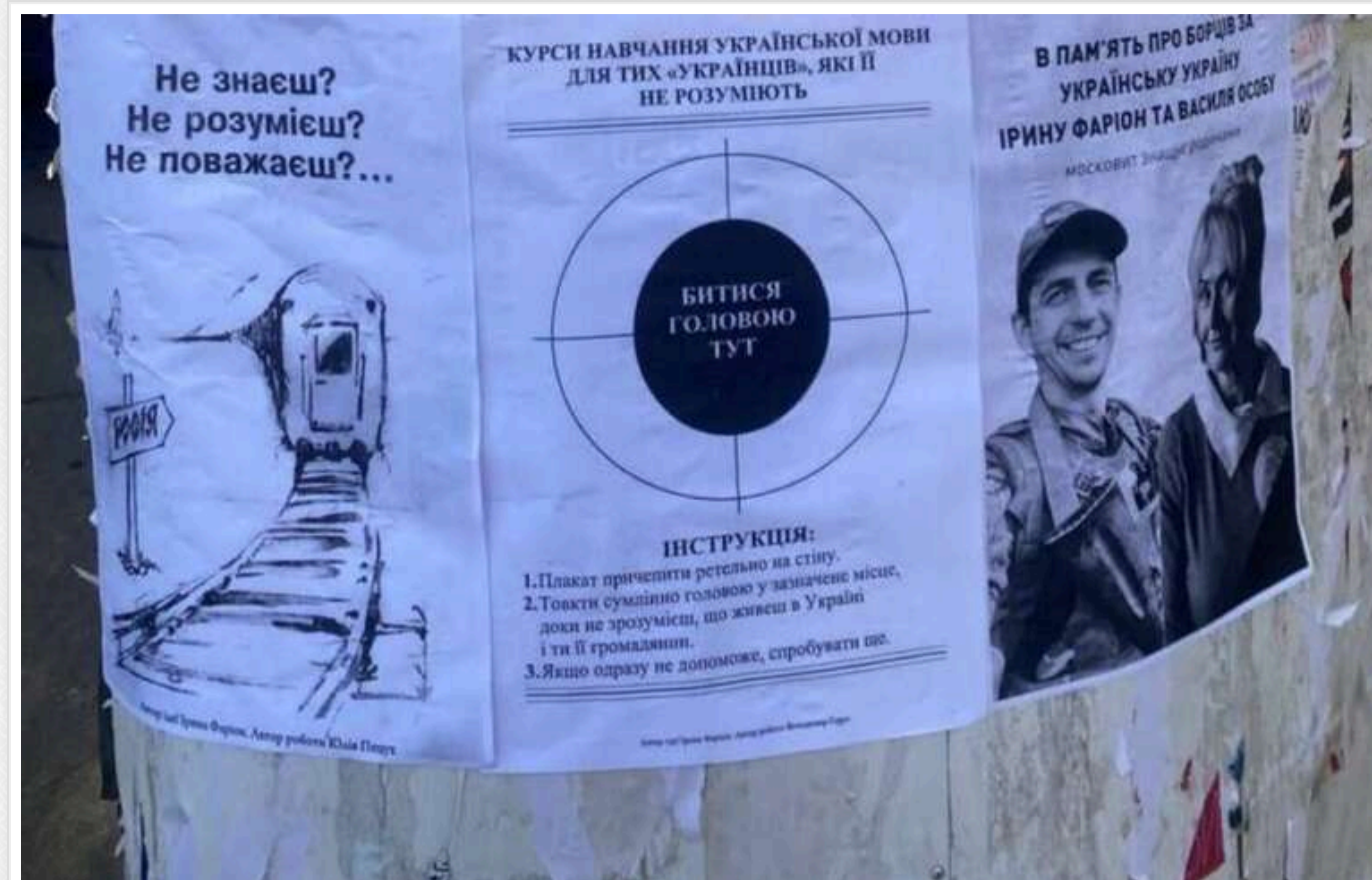
В Одесі розклеїли «інструкції» для тих, хто не розмовляє українською мовою

Одеські активісти зайнялись питанням мови в регіоні.