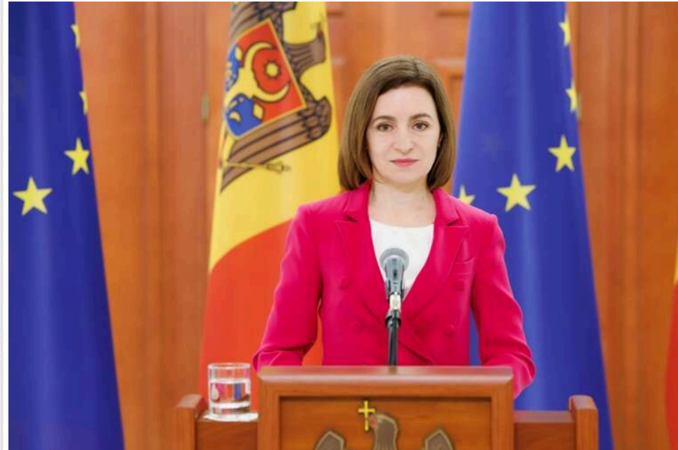
Президентка Молдови Санду не прийшла на дебати з двома проросійськими кандидатами

Президентка Молдови Мая Санду, яка претендує на новий термін, не з'явилася на дебати з кандидатами у президенти Александром Стояногло і Ренато Усатим.