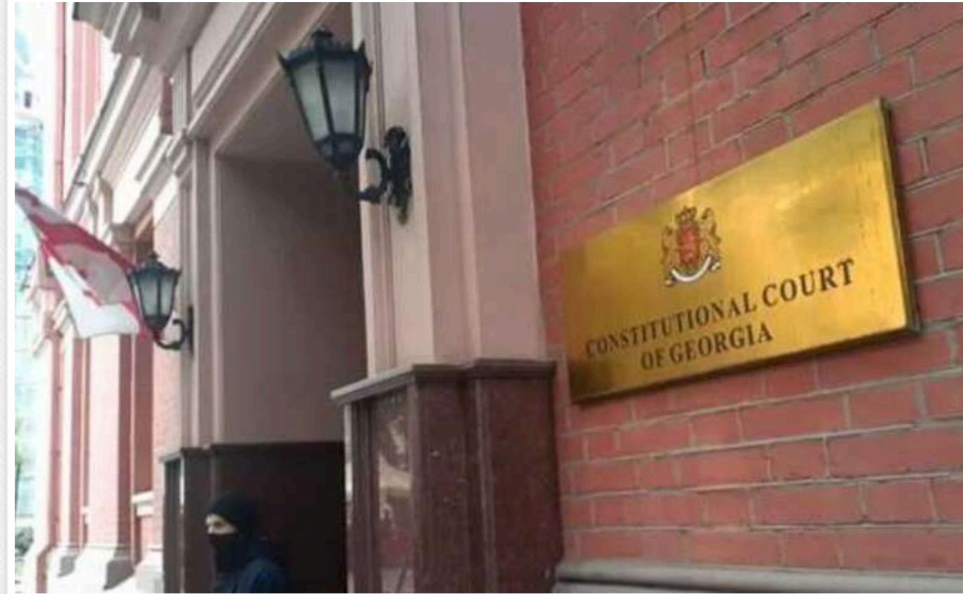
У Грузії Конституційний суд не став призупиняти сумнозвісний закон про "іноагентів"

Конституційний суд Грузії не зупинив дію відомого закону "Про прозорість іноземного впливу" (закону про "іноагентів"), ухвалення якого стало однією з причин уповільнення руху Грузії до ЄС.