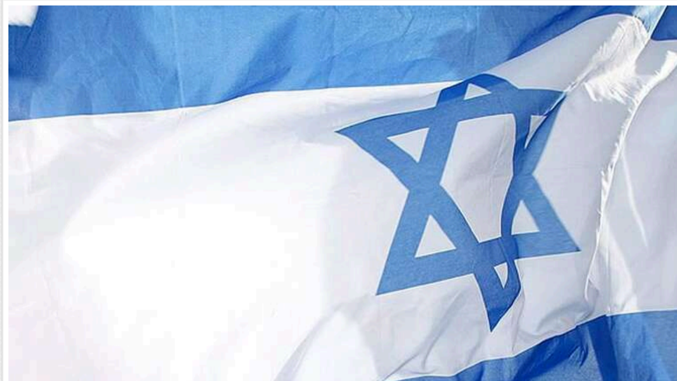
99 американських лікарів звернулися до Байдена з закликом припинити підтримку Ізраїлю

За їхніми словами, фактична кількість загиблих в Газі перевищила 118 тисяч осіб.