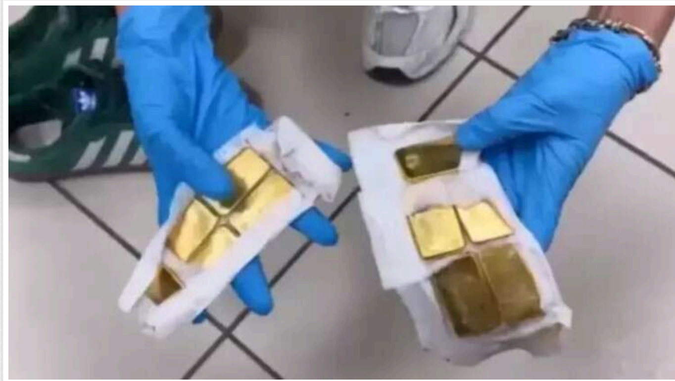
У Туреччині було затримано жінок, які намагалися провезти понад 9 кг золота в геніталіях

В аеропорту міста Ізмір у Туреччині правоохоронці затримали шістьох громадянок Узбекистану, які прилетіли з ОАЕ. Жінки контрабандою везли золоті злитки, які були зашиті в їхніх геніталіях. Загалом у статевих органах "мандрівниць" було 9 кг 240 г коштовного металу.