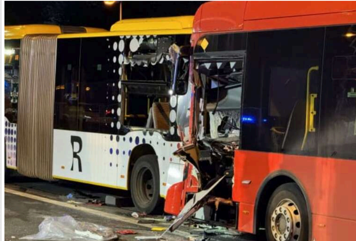
У німецькому Регенсбурзі внаслідок зіткнення двох автобусів постраждало близько 50 осіб

Близько 50 людей постраждали в результаті серйозної аварії між двома автобусами на мосту в німецькому місті Регенсбург.