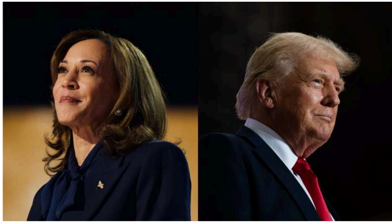
Росія зацікавлена в перемозі Трампа, Іран – в Гарріс, - розвідка

Посадовці американської розвідки заявили, що Росія, Іран і Китай залишаються відповідальними за більшість спроб впливу на виборців у США.