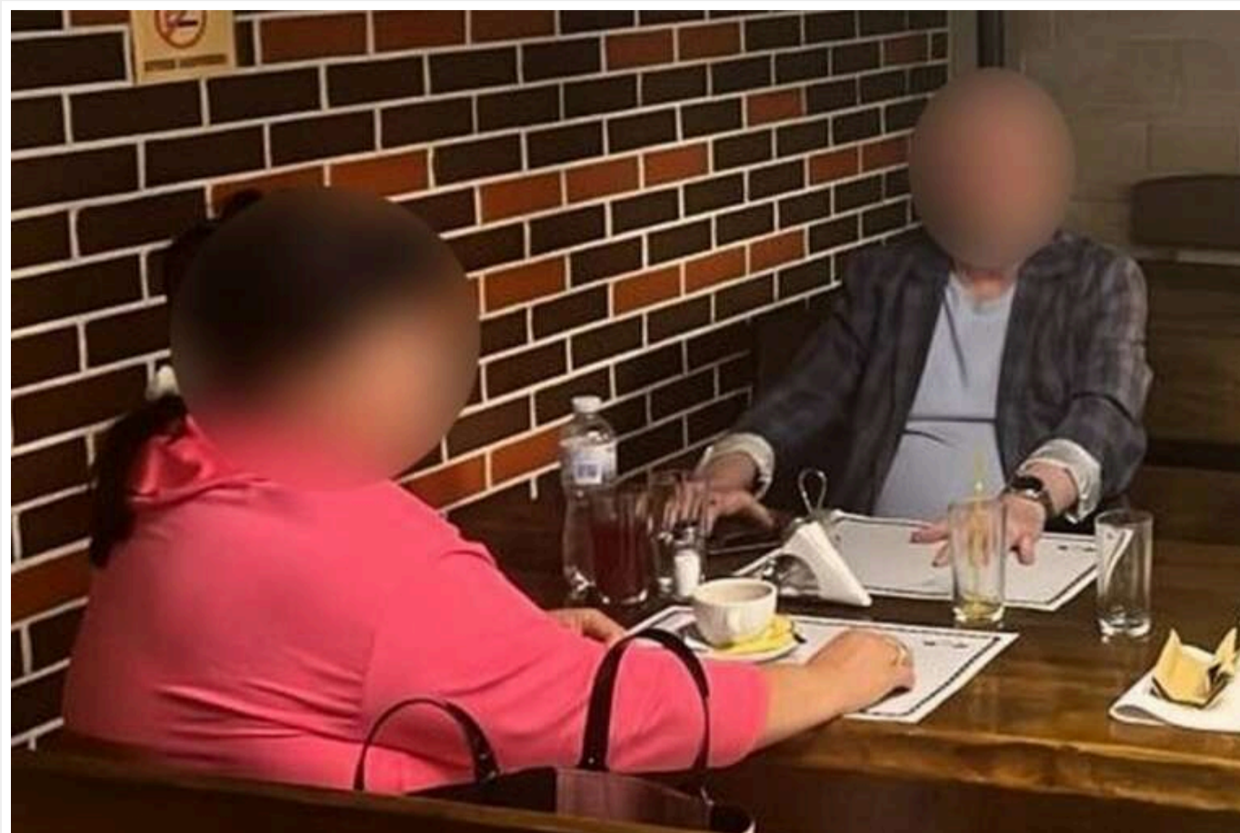
На Полтавщині викрили шахраїв, які за гроші обіцяли посприяти в призначенні на посади на двох підприємствах міста

Під процесуальним керівництвом Полтавської обласної прокуратури були викриті троє осіб з м. Дніпро: місцевий житель, вчителька та колишня працівниця міськради.