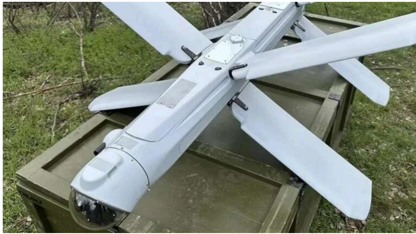
Дрон ЗСУ наздогнав і знищив російський "Ланцет"

Українські захисники продовжують виявляти та знищувати цінну техніку противника. На цей раз дрон "Дикий шершень" наздогнав та знищив російський далекобійний "Ланцет".