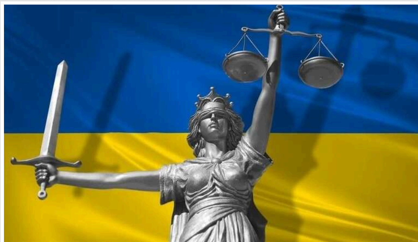
На Херсонщині викрили 29 спільників росіян

Оголошені імена 29 зрадників (включаючи колишніх працівників правоохоронних органів України), які влаштувалися на роботу до окупантів у "МВС РФ" на лівобережжі Херсонщини. Усі вони отримали заочні підозри.