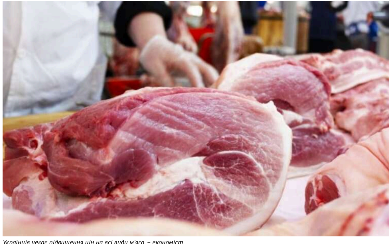
Українців чекає підвищення цін на всі види м'яса, – економіст

Це станеться через підвищення цін на електроенергію, пальне та підняття податків.