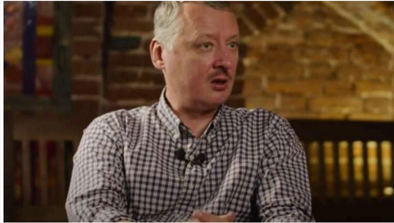
Із СІЗО Гіркін роз'яснив, де і як буде визначатися підсумок війни РФ проти України

Україна буде вести будь-які мирні переговори з Росією виключно з позиції сили та перемоги, вимагаючи поступок просто за саму готовність до переговорів, лише для того, щоб знову "обдурити" Кремль.