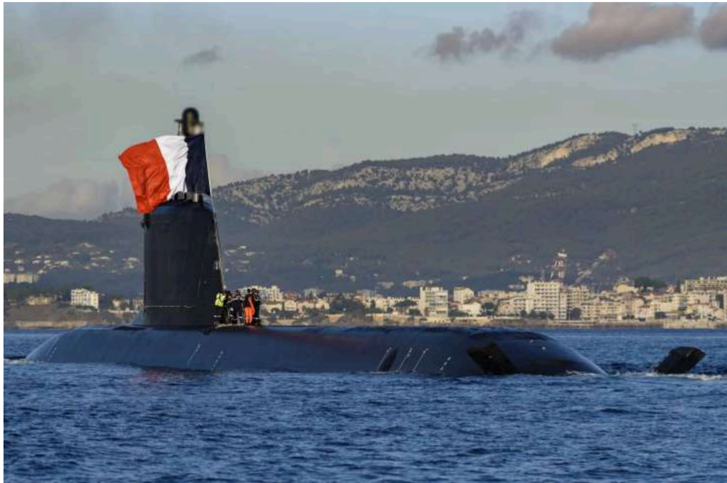
Фото: Атомний підводний човен SNA Tourville

Представники Франції та Німеччини розпочали переговори щодо програми ядерного стримування, ініційованої Парижем. Про це повідомляє Der Spiegel .