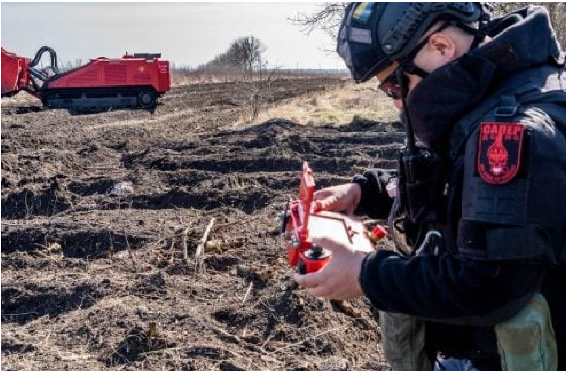
Штучний інтелект

КАРПЕЦЬ ОЛЕКСАНДР — 30 Травня 2026, 21:19 ⌚ 2 Mins Read — АРМІЯ І ЗБРОЯ