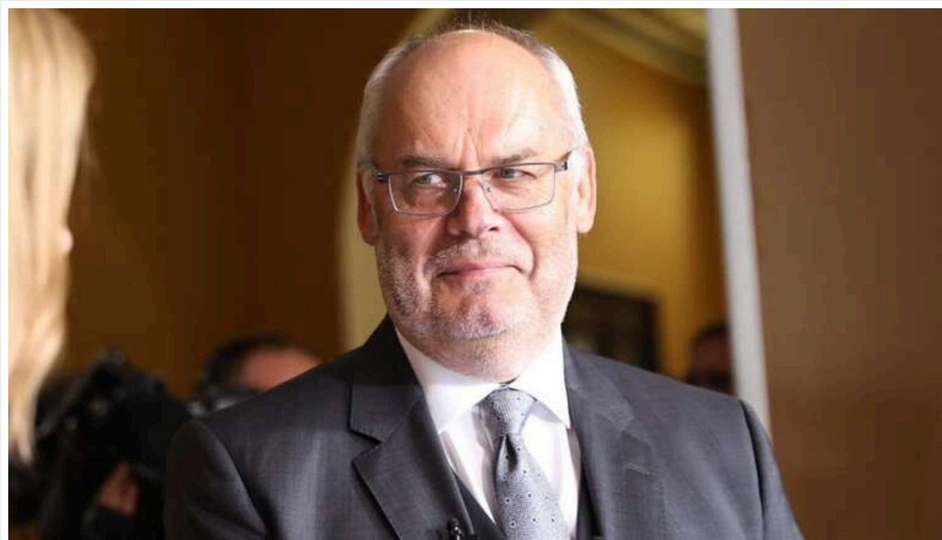
Президент Естонії Алар Каріс закликав зняти обмеження на використання зброї для ударів ЗСУ вглиб РФ

Кали справа доходить до досягнення імпералістичних амбіцій, Росію не хвилює ціна, чи то гроші, чи то людські життя, і її необхідно змусити зрозуміти, що жодна країна не може нав'язати свою волю сусідам за допомогою війни.