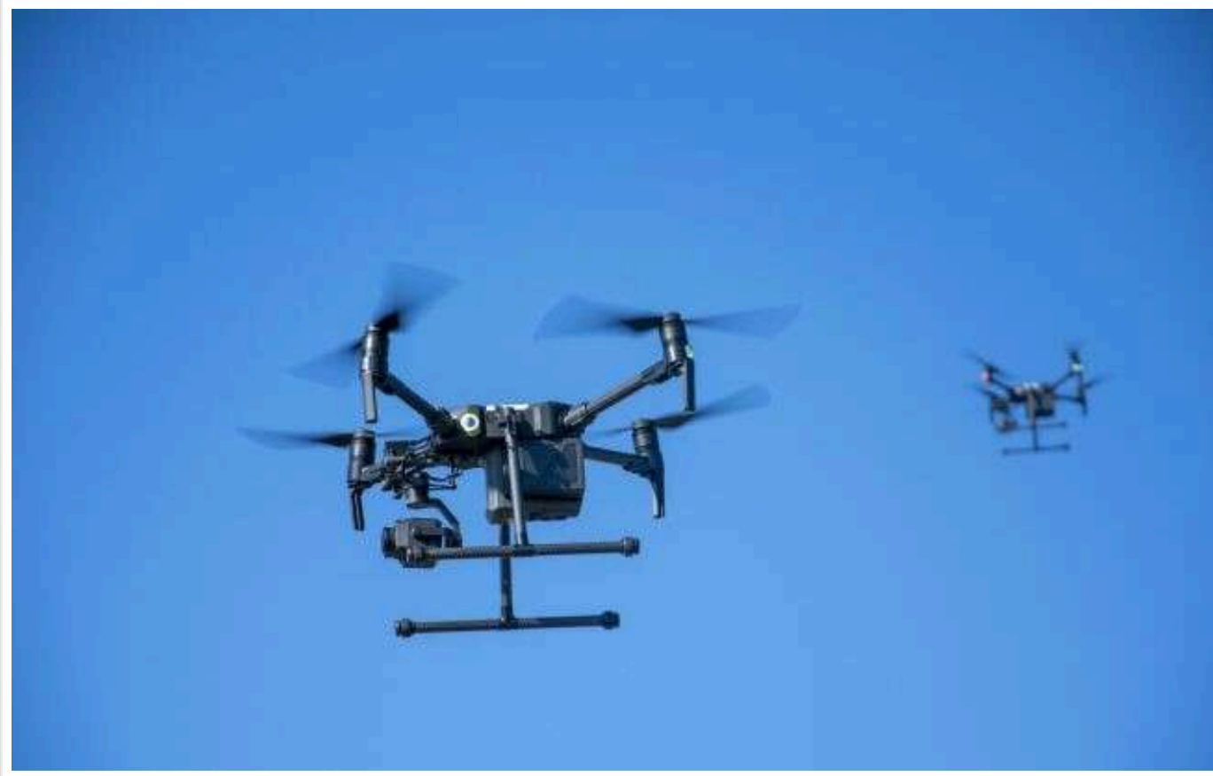
FPV-геноцид: ворожі дрони знищують усе живе на прифронтових територіях

Останнім часом безпілотники стали справжнім лихом для мирних жителів, які живуть поблизу лінії фронту. Вони вже зараз завдають більшої шкоди, ніж снаряди, КАБи та РСЗВ. І ситуація може значно погіршитися в недалекій перспективі.