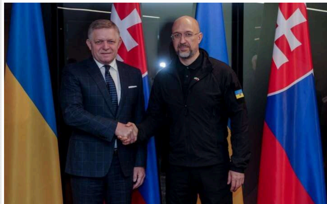
Ми не проти вступу України до ЄС, але досить «холодно» ставимося до членства в НАТО, - Фіцо

“Словацьчина зацікавлена у відновленні України та в добросусідських відносинах. Ми розуміємо, що цей мир має бути для вас якісним, стійким.