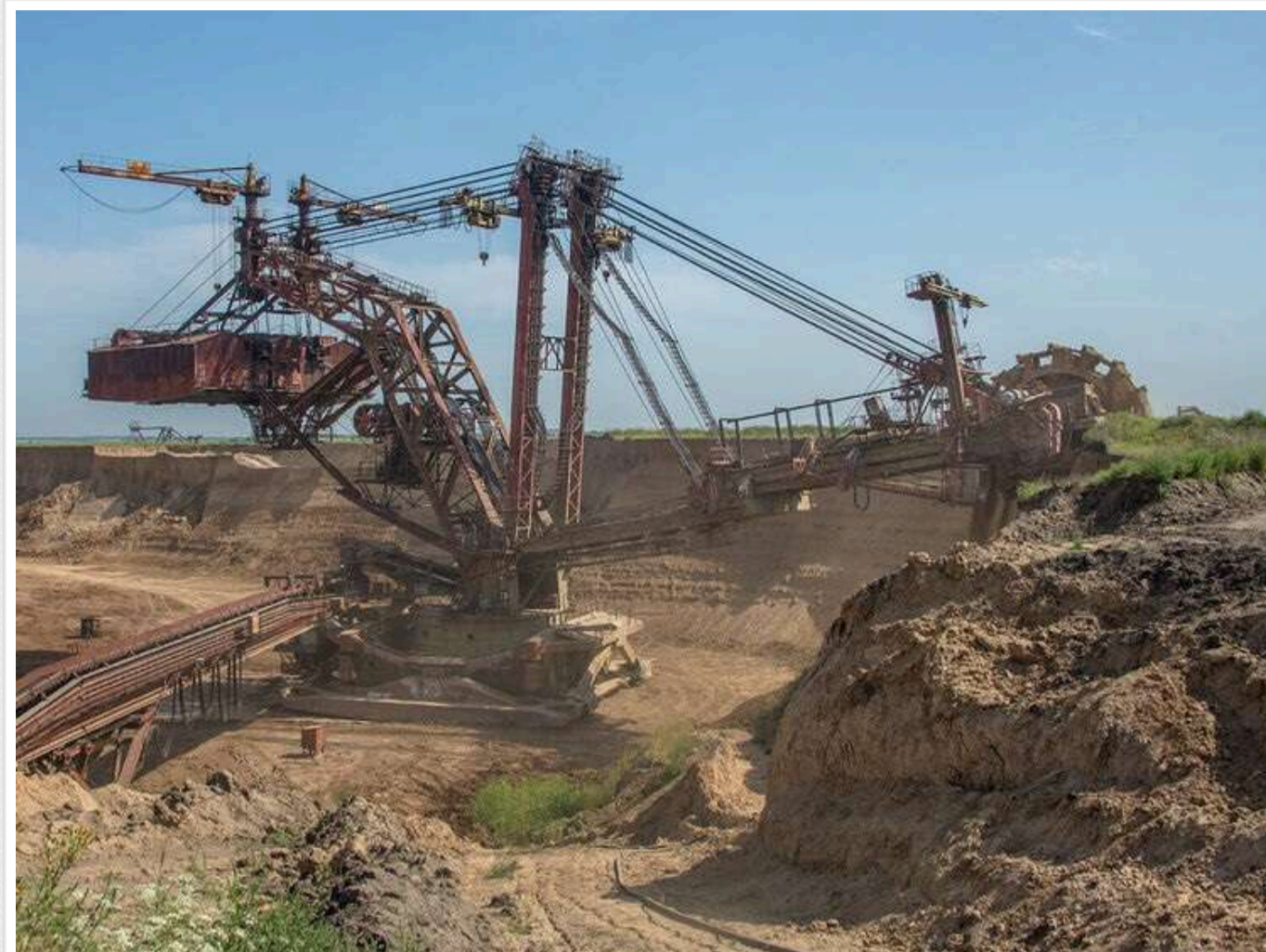
На Вільногірському комбінаті уклали угоду з новим підрядником на 139 мільйонів і земляні роботи подорожчали в доларах на 21%

АТ «Об'єднана гірничо-хімічна компанія» 20 вересня уклало угоду з ТОВ «Будівельна компанія «Олімпікс» про земляні роботи з розробки кар'єрів для філії «Вільногірський гірничо-металургійний комбінат» на 139,01 млн грн.