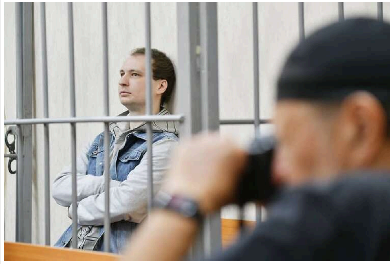
У РФ засудили 2 громадян США