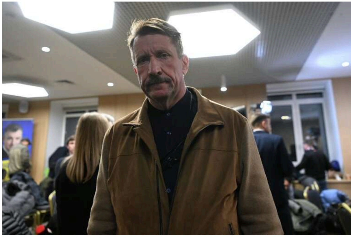
Віктор Бут повернувся в збройний бізнес, - WSJ

Російський торговець зброєю Віктор Бут, який був звільнений з американської в'язниці в обмін на баскетболістку Брітні Грайнер, повернувся до своєї діяльності та тепер виступає посередником в угоді з продажу зброї з Росії єменським хуситам, повідомляє The Wall Street Journal.