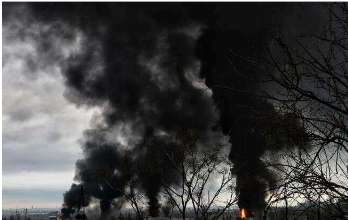
ЗС РФ знову обстріляли Суми: є влучання

6 жовтня, російські окупанти здійснили черговий обстріл міста Суми.